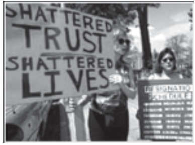
საპროტესტო ლოზუნგები: დანგრეული სიცოცხლეები დანგრეული ნდობა

„უცდომელობა“? ერთხელ ხომ უკვე მოუხადა ბოდიში რომის „ეკლესიამ“ კაცობრიობას ინკვიზიციის, პაპის სახელით ცეცხლში დამწვარი ათიათასობით ადამიანის გამო. ის რა „ეკლესიაა“, რომელიც საბოდიშოდ იხდის საქმეს? ვატიკანს საგანგებო ბოდიში აქვს მოსახდელი მართლმადიდებლებისათვის, თუ როგორ ხოცავდა მათ ყველგან, სადაც ხელი მიუწვდებოდა. სულ ახლახან, 10-ოდე წლის წინ პოლონეთში კათოლიკეებმა მართლმადიდებელი ბერები დახოცეს და მათი მონასტრები დაარბიეს. გერმანელ-ფაშისტთა საკონცენტრაციო ბანაკებში კათოლიკე-უსტაშები ისეთი სისასტიკით ხოცავდნენ მართლმადიდებლებს, რომ ფაშისტებიც კი განცვიფრებაში მოჰყავდათ. უკრაინის ოკუპაციის დროს მხოლოდ კათოლიკურ-უნიატური „ეკლესია“ თანამშრომლობდა ფაშისტებთან. ვაშინგტონელი ადვოკატი ჯონათან ლევი იცავს საკონცენტრაციო ბანაკის ტუსაღების ინტერესებს,