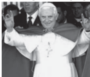
პაპი ბენედიქტე XVI